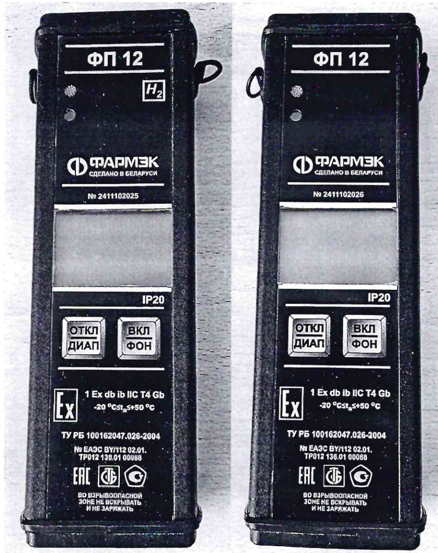
Рисунок 1.1 – Фотографии общего вида и маркировки течеискателей-сигнализаторов ФП 12 (изображение носит иллюстративный характер)