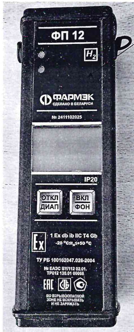
Рисунок 2.1 – Схема (рисунок) с указанием места для нанесения знака поверки средства измерений